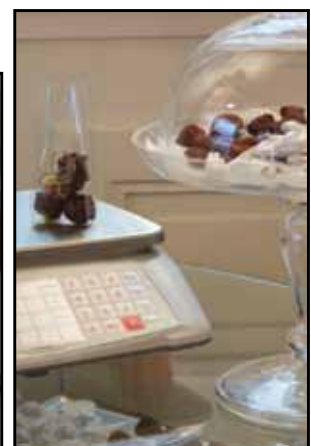
Édesség, csokoládé és tea