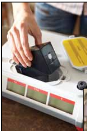
Mozgó értékesítés - elemről történő tápellátással