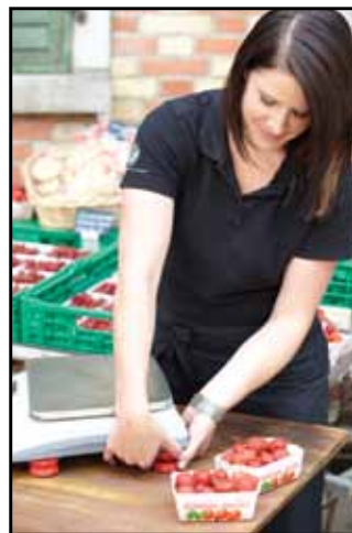
Állítható magasságú lábak