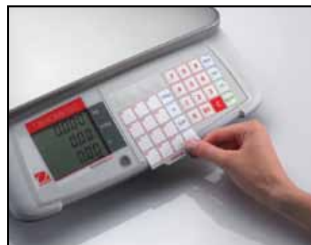
Cserélhető áru- lista kártya