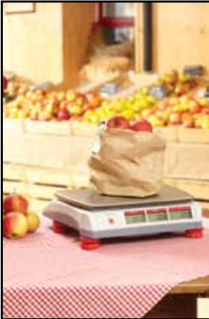
Gyümölcs és zöldség- piacok

Az Aviator 5000 stílusos, hordozható kiskereskedelmi mérleg alkalmas arra, hogy számos kiskereskedelmi környezetben használják, mint például a nyitott piacokon, a mozgó értékesítésekben vagy kisebb szaküzletekben. A robusztus, mégis könnyű konstrukció, beleértve a kiváló minőségű rozsdamentes acéllemezből készült teherfellevőt tökéletesen illeszkedik bármely környezetbe, ahol az élelmiszerhigié- nia, a hordozhatóság és a precizitás alapvető követelmény. A magas minőségű mérési technológia teszi a Aviator-t megbízható és tartós befektetéssé. A mérleg használata gyors és egyszerű köszönhetően az ergonomikus billentyűzetnek és az egyszerű felhasználói felületnek, melyek - felgyorsítják az ügyfél kiszol- gálását.