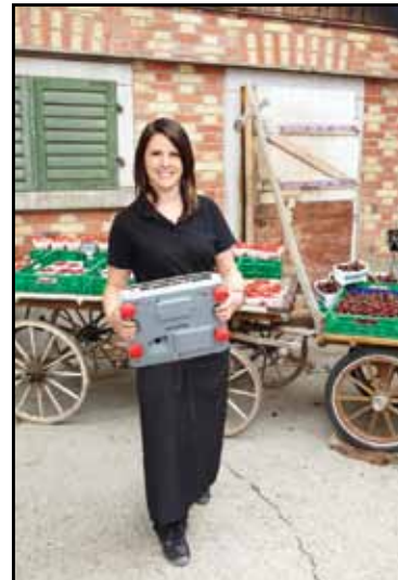
Egyszerű hor- dozhatóság a beépített fogantyú segítségével